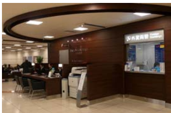
コンシェルジュ東京 Station Concierge Tokyo