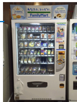
Light-meals Vending machine