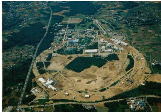
建設進むトリスタン施設と高エ研全景 (1985年)

今年的一般公開では1980年代から1990年代にかけて活躍した「トリスタン加速器」について説明します。