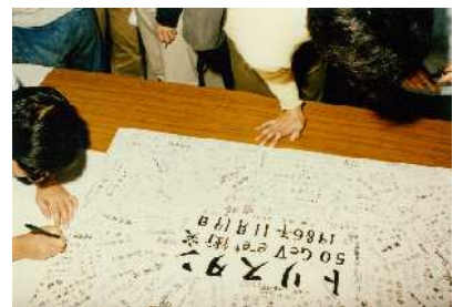
トリスタン50GeV電子・陽電子衝突達成 1986年11月19日(寄せ書き)