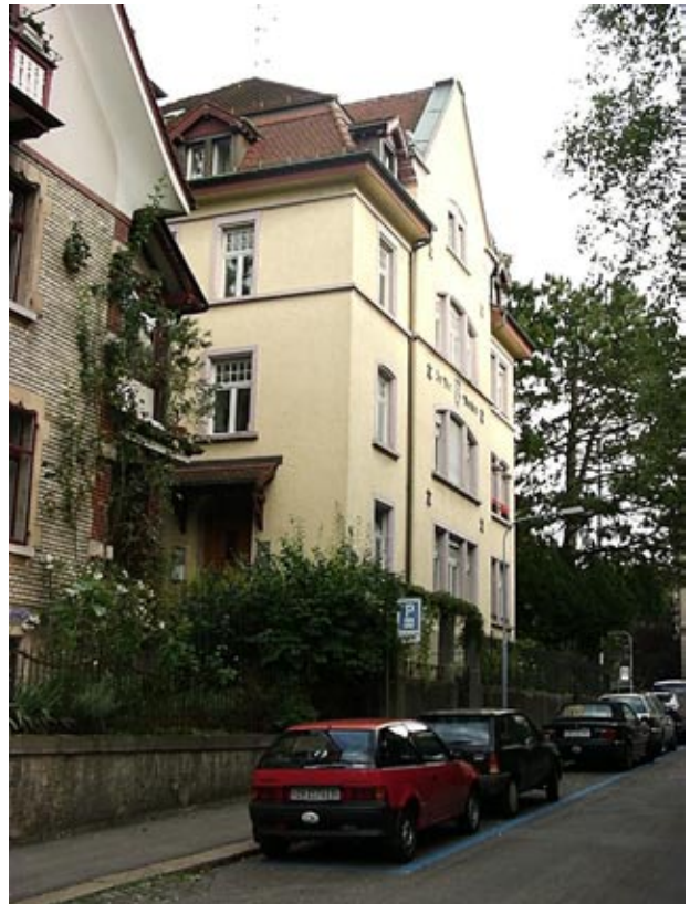
Figure 3 かつてシュレディンガーが住んでいた家。静かな場所で、チューリッヒ大学までは歩いて 10 分位の所です。

スイスのチューリッヒと言えばアインシュタイン、ディラック、そしてシュレディンガーといった量子力学を築き上げた著名な物理学者が住んでいた街でもあります。そ