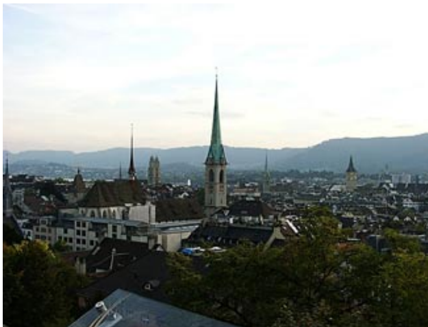
Figure 2 チューリッヒの街の風景。晴れた日はチューリッヒ湖の向こうに爽快なアルプス山脈が見えました。

さて、ここで私の住んだ街、チューリッヒについて御紹介したいと思います。チューリッヒはチューリッヒ州の州都であり、スイスの経済、商工業、文化を担うスイス最大の都市で人口は約 84 万人です。またスイスの空の玄関口、チューリッヒ国際空港を抱え様々な人種が集まった国際都市であり、一方中世の建造物も数多く残っているが古さと新しさが見事に融合した素晴らしい観光地でもありました (Fig. 2)。私は平日の間はチューリッヒ大学内で日本でも使い慣れた超高真空実験装置や読み慣れた国際ジャーナルに囲まれてあまり環境の違いを感じませんでした。