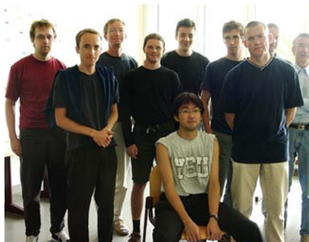
Figure 4 私の Farewell パーティーにて、オストワルダール研究室のみなさんと。2001年8月。