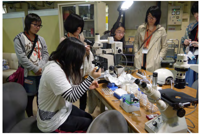
図1 2日目午後の「加速器体感ツアー」では、Linac, PF, SuperKEKB, Belleの4カ所に分かれて加速器を用いた研究を「体感」。PFツアーでは、XAFSビームラインを見学し、実際の試料（藻類細胞）を取り扱ってみました。

このイベントはTYLとKEK男女共同参画推進室が企画した女子高校生を対象とするスクールで、2012年の3月に引き続き、今回が2回目となります。女子高校生に科学に興味を抱いてもらえるように、科学実験、女子大学院生との懇談会、女性研究者による講義、施設見学などのプログラムから構成されています。TYLが主催ですので、昨年は素粒子物理学分野を中心とした講義が組まれていましたが、今年ももっと広い分野から講師を選出する方針で企画