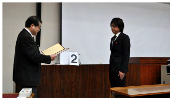
図 1 授賞式の様子。

これは、現在、固体光電子回折で計測されている現象の側面を、気体分子でも観測可能にした成果で、気体光電