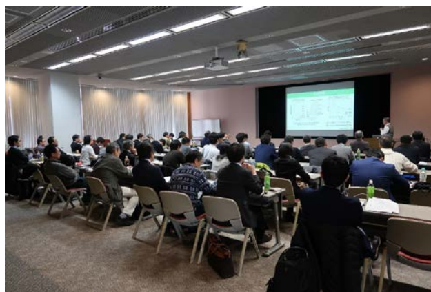
図 2 会場の様子

乱ユーザーが一堂に会して、たくさんの研究発表を一つの講演会場で座して聴講する機会を持つことは、非常に有効です。しなしながら、ご自身が所属している学協会以外の研究発表の場には、なかなか参加する機会がなく、自らそのような機会を作ることは困難です。このような機会を作ることは、研究のツールとして小角散乱という同じツールを用いているユーザーグループの使命であると考え、このような企画を立案した次第です。