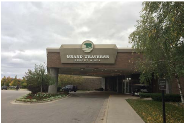
図2 開催会場 (Grand Traverse Resort & Spa) のエントランス写真

ら導いた詳細な三次元モデルが示され、視覚的に分かり易い発表が多かった印象です。モデリングのセッションでは新しい解析法やプログラムがいくつも発表され、小角散乱の解析法が発展途上であることを知ることとなりました。これら多くの講演を聴講したことで小角散乱が測定手法として進化し続けていることを痛感し、研究者として取り残されないように日頃からの情報収集を心がけたいと思いました。