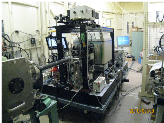
DACを用いた(レーザー加熱)超高压回折実験装置

50 keV, 30 keV, 14.4 keV の3種類の単色光が使用でき、PF-ARの単バンチ運転を利用したメスバウアー散乱実験のために、通常の光学系に高分解能分光器を挿入して14.4 keVの光を準超単色化する仕組みが整備されています。実験装置はYAGレーザー加熱光学系を備えたDAC実験ステージと、低温高磁場下での高圧実験ができる低温クライオスタットが整備されています。ビームタイム期間中には、DACによる(レーザー加熱)超高压回折実験の他に、超伝導マグネットを用いた超伝導体の高圧下メスバウアー実験や、表面・界面のメスバウアー実験、S型課題の単結晶高圧構造解析など実験手法・装置の異なる課題が混在しています。そのため、実験装置の入れ換えや光学系調整に掛かる時間を短くするために、ユーザーへの希望調査時に前もって大凡の割り当て期間を伝えるなどの工夫をしています。