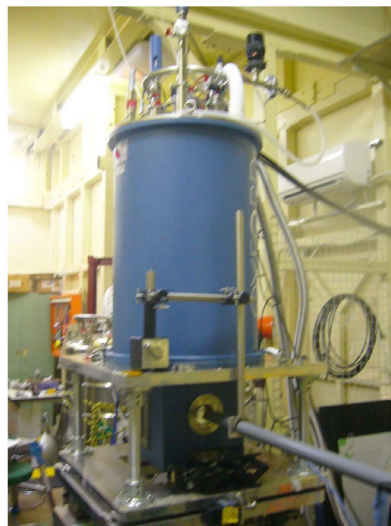
低温強磁場下でのメスバウアー実験装置