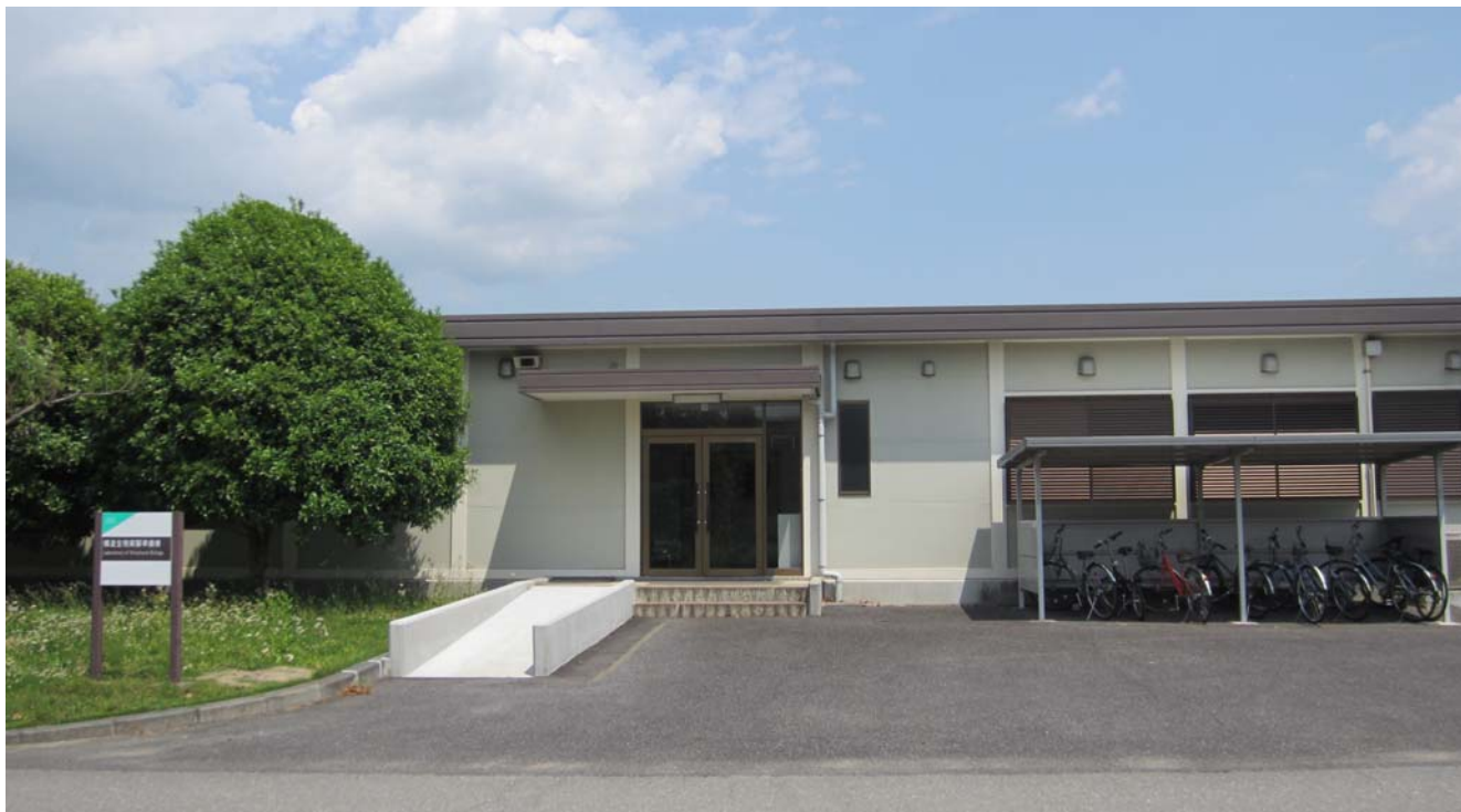
【構造生物実験準備棟外観】