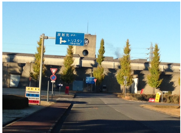
写真1 交差点の標識