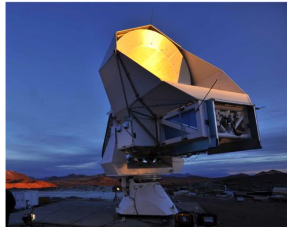
図 1 POLARBEAR 望遠鏡

2007 年 12 月より米国等のグループとの国際協力により QUIET 実験を推進している。2012 年 7 月に、新たな観測結果を論文として The Astrophysical Journal に投稿し、その論文がレビューを通過し掲載された (ApJ 760, 145 (2012))。これは現在世界トップレベルの CMB 偏光観測結果となっている。これとあわせて QUIET 実験装置に関する技術論文も最近レビューを追加し近日中に掲載号