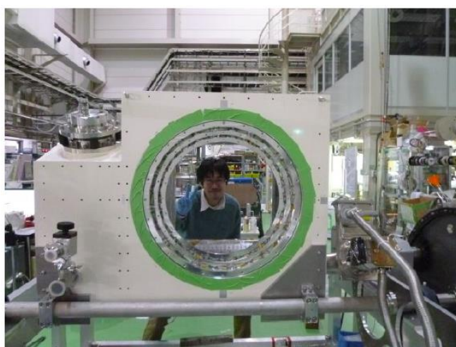
図 4 POLARBEAR-2 レーザーシステムクライオスタット