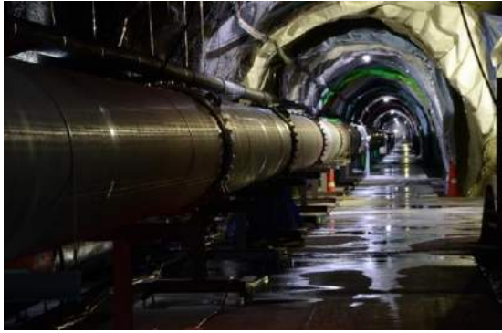
〈写真2〉 KAGRA の長さ 3 km の真空パイプの一部