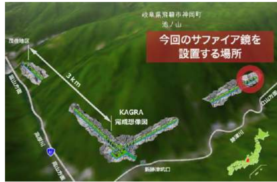
〈写真3〉 KAGRA の完成イメージ図