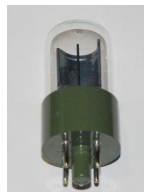
図2 : 光電管