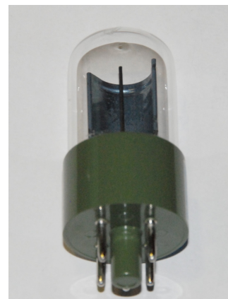
図 2: 光電管