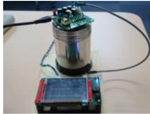
製作予定の検出器・測定の様子