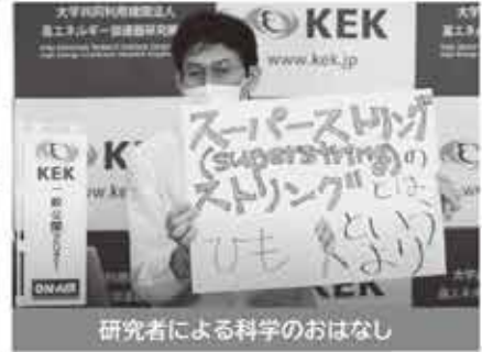
研究者による科学のおはなし