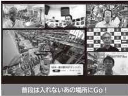
普段は入れないあの場所にGo！

楽しい企画が盛りだくさん！大人も子供も最先端研究の世界をじっくりゆっくり視聴することができます！（予約不要）