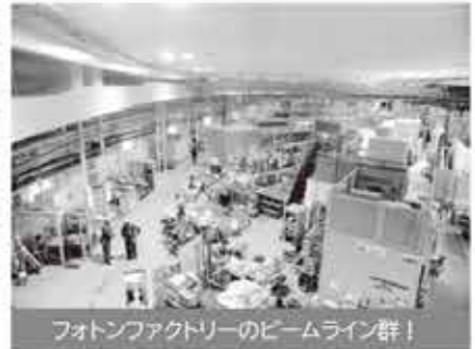
フォトンファクトリーのビームライン群！