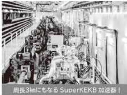
周長3kmにもなる SuperKEKB 加速器！

KEK でしか見学できない巨大実験装置群を公開します。研究者がKEKの魅力をあなたに直接お伝えします。