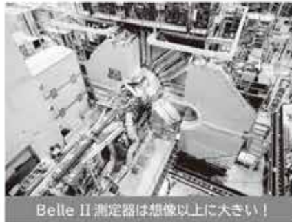
Belle II 測定器は想像以上に大きい！