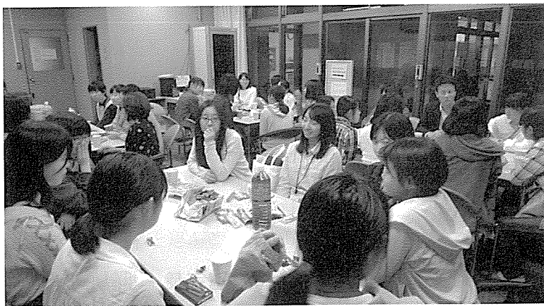
「お菓子の会」の様子