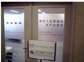
水戸出張所で Mito Office