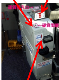
「紙幣」 Note slot