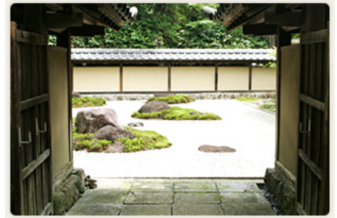
Shunpuu Banri So 春風萬里荘 9:30-17:00 600yen/adult Closed on Monday