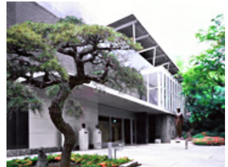
Kasama Nichido Museum of Art 笠間日動美術館 9:30-17:00 , 1000yen/adult Closed on Monday