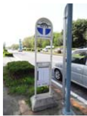
KEK バス停 KEK Bus Stop

KEK 前バス停から 北部シャトル HA ( ¥ 300 ) か関鉄バス( ¥ 440 )に 乗車、つくばセンター下車 Take Hokubu Shuttle ( ¥ 300 ) or Kantetsu bus( ¥ 440 ) to Tsukuba Center at KEK bus stop.